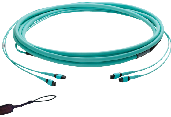
Ojal de tracción

Los cables troncales de fibra probados y terminados en fábrica conectan las ubicaciones centrales de conexión con zonas o módulos. Se encuentran disponibles terminados con conectores MTP®. Estos troncales se fabrican de manera personalizada en cualquier longitud a fin de satisfacer las aplicaciones específicas. Un ojal de tracción opcional, instalado en el primer extremo, protege a los conectores de fibra en los cables troncales de fibra. El ojal de tracción cubre por completo la longitud de la distribución a fin de transferir cualquier fuerza de tracción del conjunto a la manga del ojal de tracción. También está disponible una opción de carga de alta resistencia que incorpora Kevlar® en aplicaciones de más de 38 metros (125 pies).