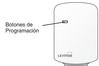
Botones de Programación

PRECAUCION: PROGRAMAR UN PRODUCTO EN SU PROGRAMACION DE FABRICA NO EXCLUYE ESE PRODUCTO DE LA RED. SE DEBE SEGUIR EL PROCEDIMIENTO DE EXCLUSION PARA SACAR EL PRODUCTO DEL LADO PRIMARIO DE LA TABLA DE INFORMACION DEL CONTROL. NO HACERLO PODRIA RESULTAR EN UN SISTEMA MUY LENTO PARA RESPONDER. O PUEDE FALLAR PARA RESPONDER A CIERTOS PRODUCTOS. SI TIENE QUE REINICIAR EL CONTROL SIN EXCLUIRLO VAYA AL MENU DE FALLAS DE SU PROGRAMADOR Y REMUEVA EL DISPOSITIVO.