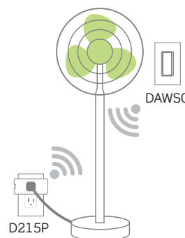
Point de commutation supplémentaire d'un ventilateur ou d'une lampe à partir de n'importe quelle surface murale.